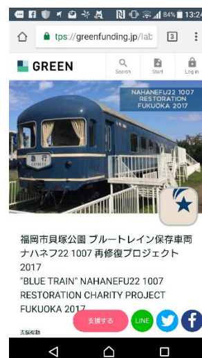
スマートフォンの場合