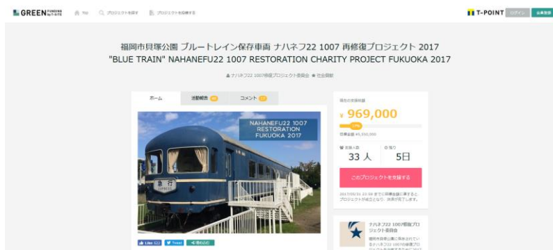
Windows (パソコン) の場合